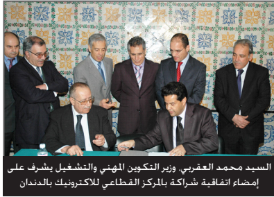
السيد محمد العفري، وزير التكوين المهني والتشغيل يشرف على إمضاء اتفاقية شراكة بالمركز القطاعي للإلكترونيك بالمدنات

تعزيزا للاستثمار في القطاعات الواعدة والمجددة، وفي لبنة جديدة على طريق الانخراط الكلي في الاقتصاد الرقمي واقتصاد الذكاء، سيتم بث مشروع مركب تكنولوجي، سيقام قبالة المركب الجامعي للمدينة، ويقدر حجم الاستثمار بـ 40 مليون دينار.