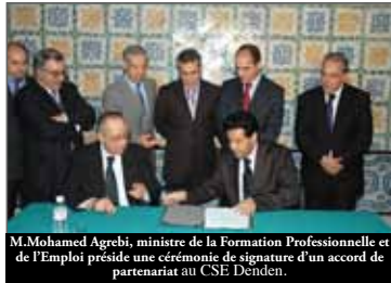
M.Mohamed Agrebi, ministre de la Formation Professionnelle et de l'Emploi préside une cérémonie de signature d'un accord de partenariat au CSE Dendén.

Le gouvernorat de la Manouba bénéficie, depuis le Changement d'un intérêt particulier qui s'adosse sur de nombreux acquis, dans divers secteurs. C'est ainsi qu'une plateforme adéquate pour l'instauration d'un réseau de zones industrielles capables de polariser les investissements et d'améliorer le climat d'affaires a été mise en place.