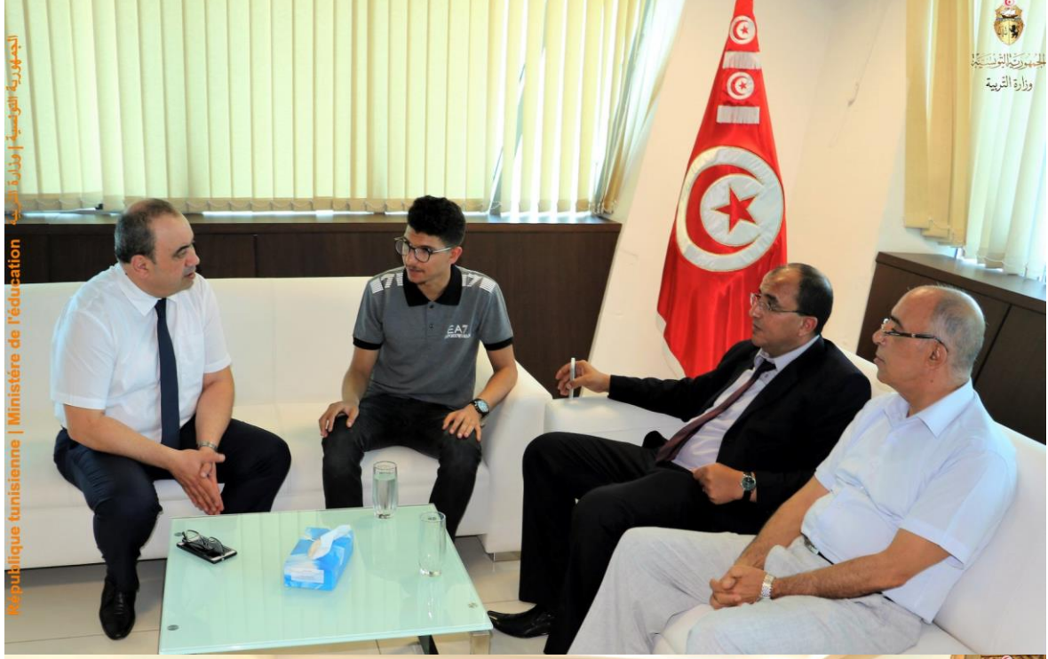
الجمهورية التونسية | وزارة التربية République tunisienne | Ministère de l'éducation