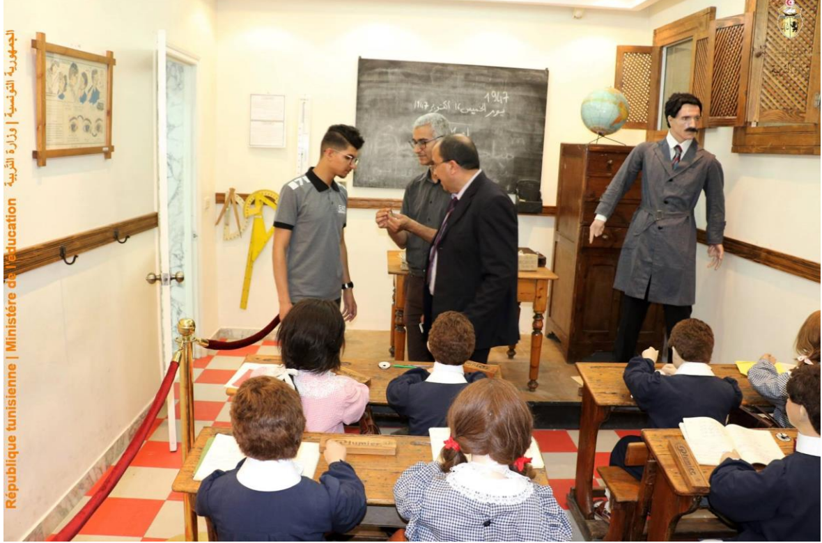
الجمهورية التونسية | وزارة التربية République tunisienne | Ministère de l'éducation