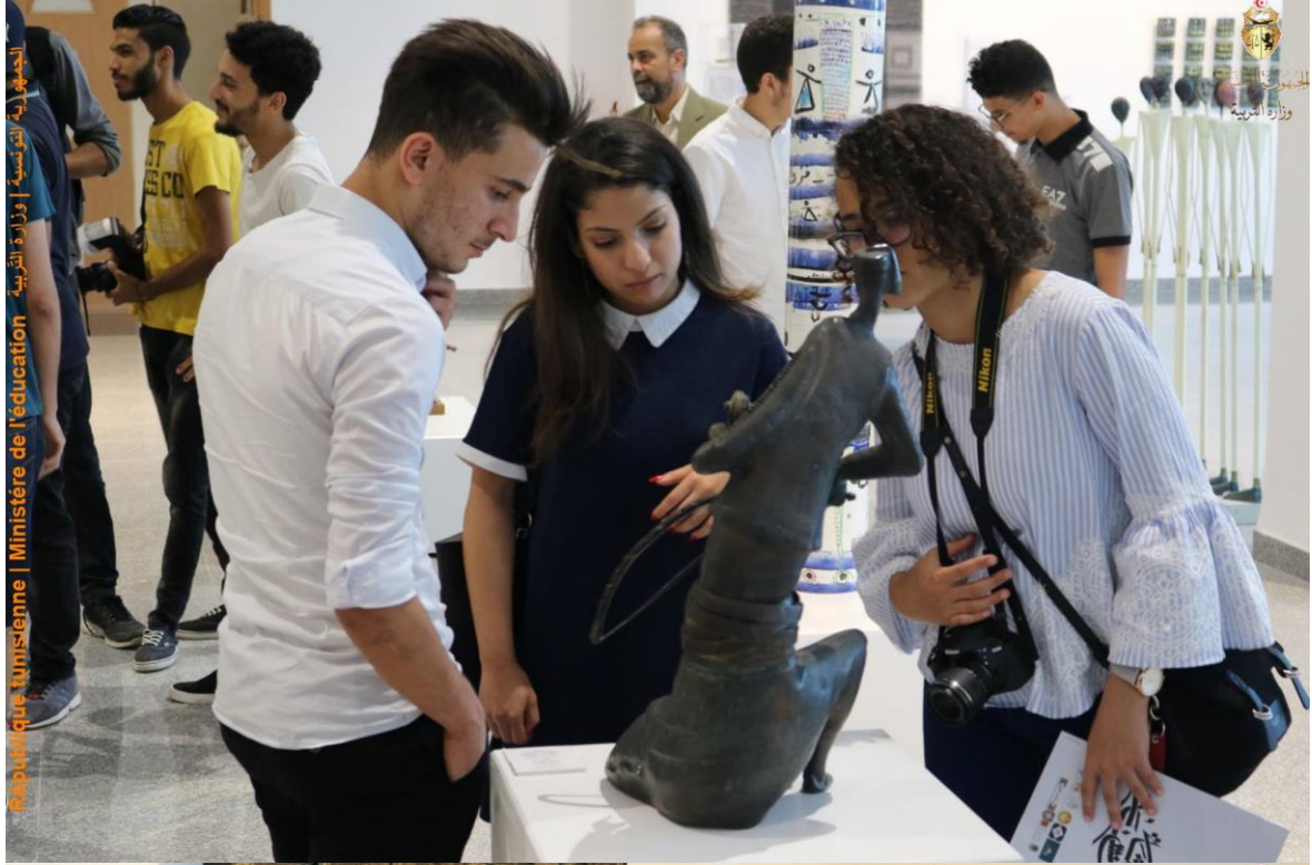
الجمهورية التونسية | وزارة التربية | Ministère de l'éducation