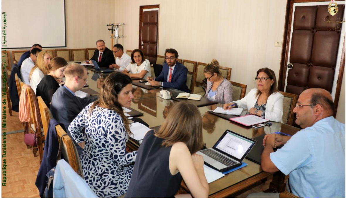
الجمهورية التونسية | وزارة التربية - Ministère de l'éducation