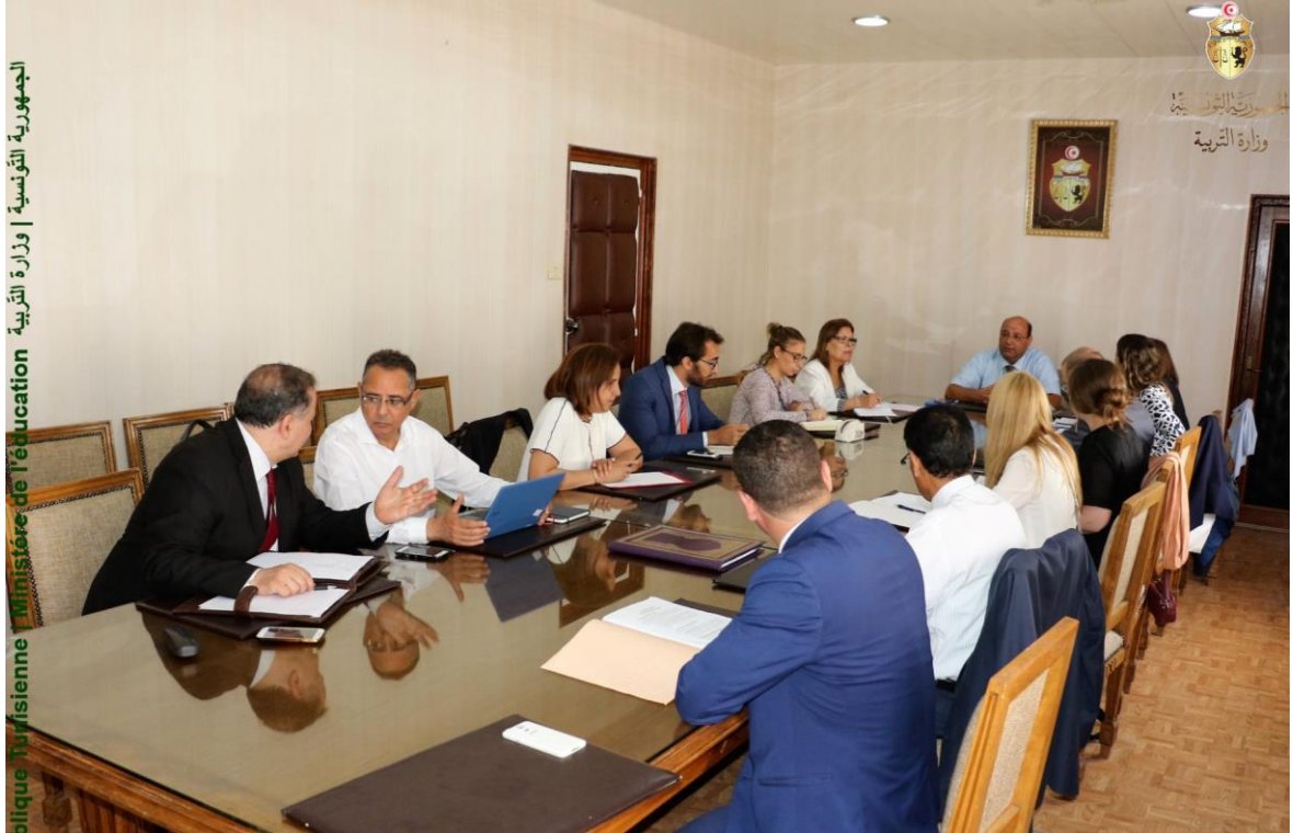
الجمهورية التونسية | وزارة التربية - Ministère de l'éducation