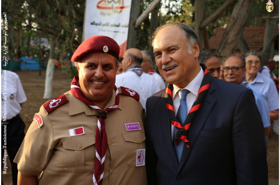
الجمهورية التونسية | وزارة التربية | Ministère de l'éducation | République Tunisienne