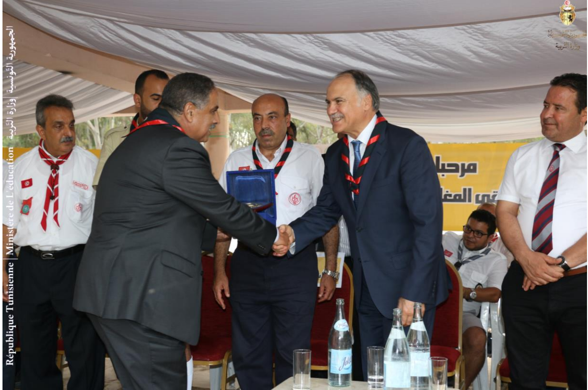
الجمهورية التونسية | وزارة التربية | Ministère de l'Éducation