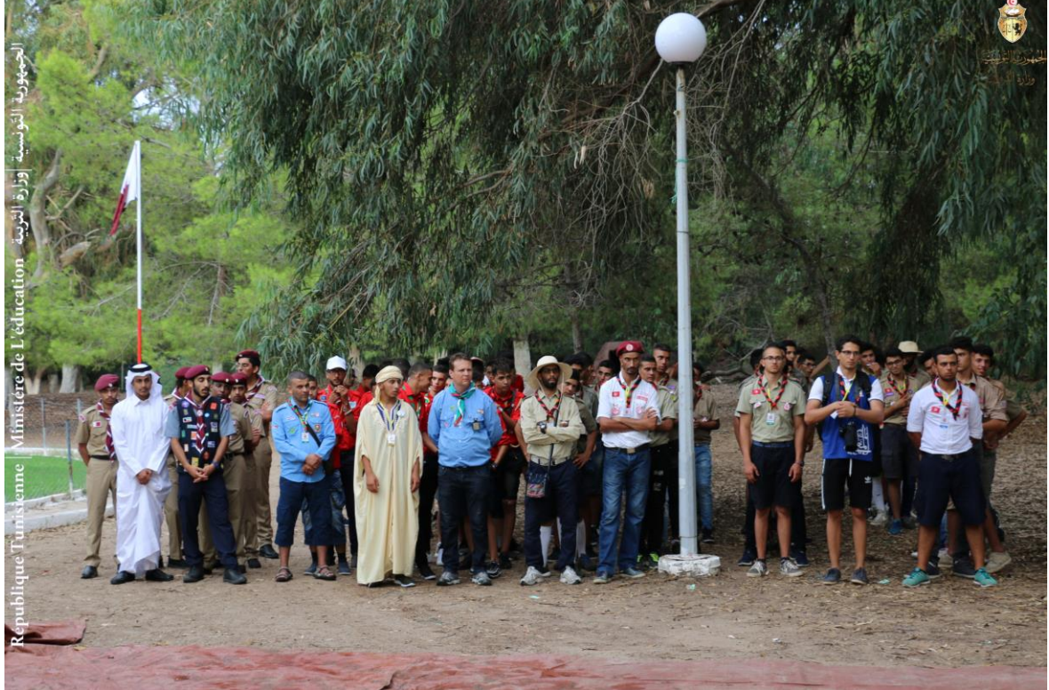
الجمهورية التونسية | وزارة التربية | Ministère de l'éducation | Republique Tunisienne