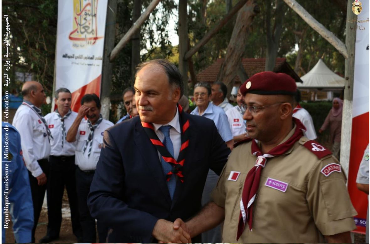
الجمهورية التونسية | وزارة التربية | Ministère de l'Éducation