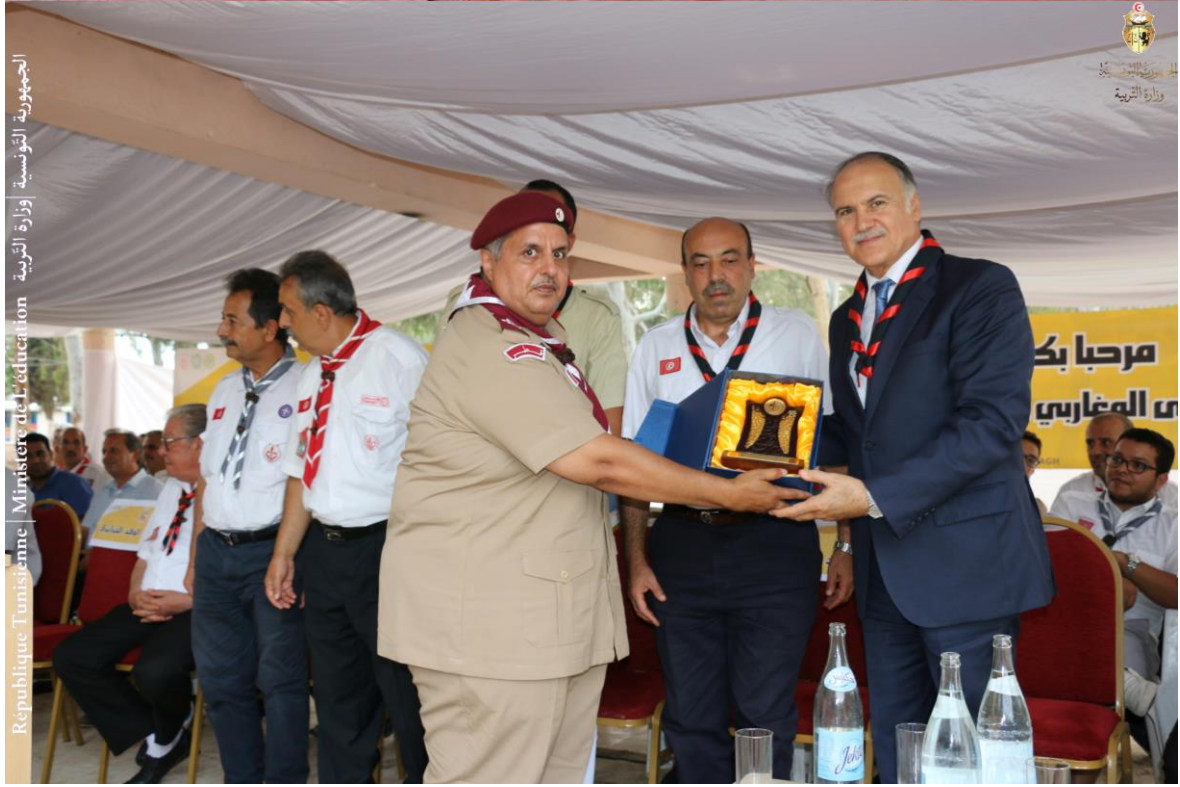
الجمهورية التونسية | وزارة التربية | Ministère de l'éducation | Republique Tunisienne