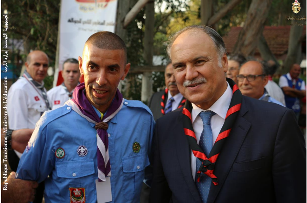
الجمهورية التونسية | وزارة التربية | Ministère de l'Éducation