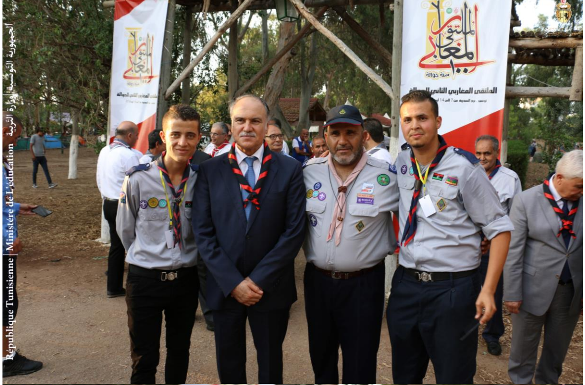
الجمهورية التونسية | وزارة التربية | Ministère de l'éducation | République Tunisienne