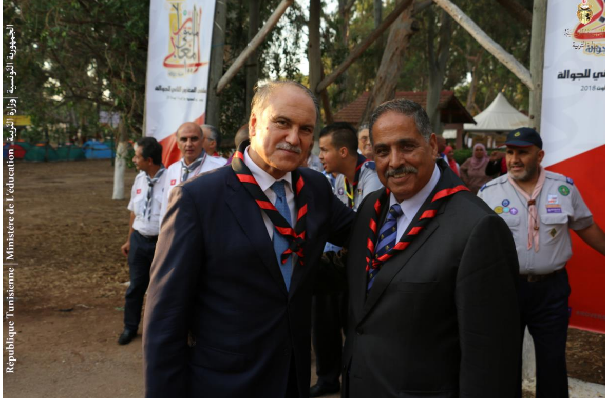
الجمهورية التونسية | وزارة التربية | Ministère de l'Éducation