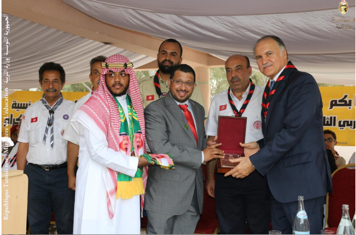
الجمهورية التونسية | وزارة التربية | Ministère de l'Éducation