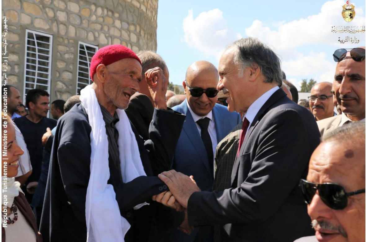
الجمهورية التونسية | وزارة التربية | Ministère de l'éducation | République Tunisienne