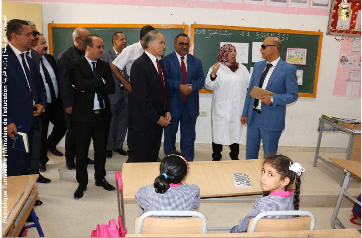
الجمهورية التونسية | وزارة التربية | Ministère de l'éducation | République Tunisienne