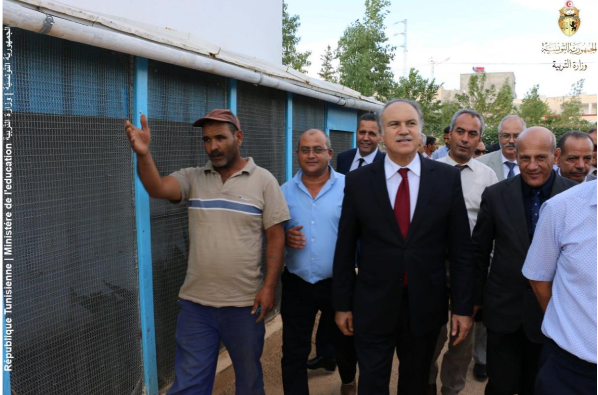
الجمهورية التونسية | وزارة التربية | Ministère de l'éducation | République Tunisienne