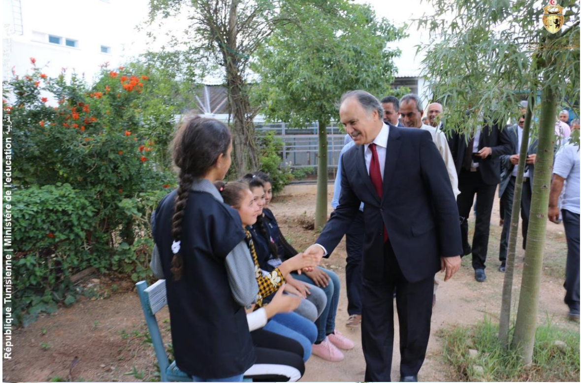
الجمهورية التونسية | وزارة التربية | Ministère de l'éducation | République Tunisienne