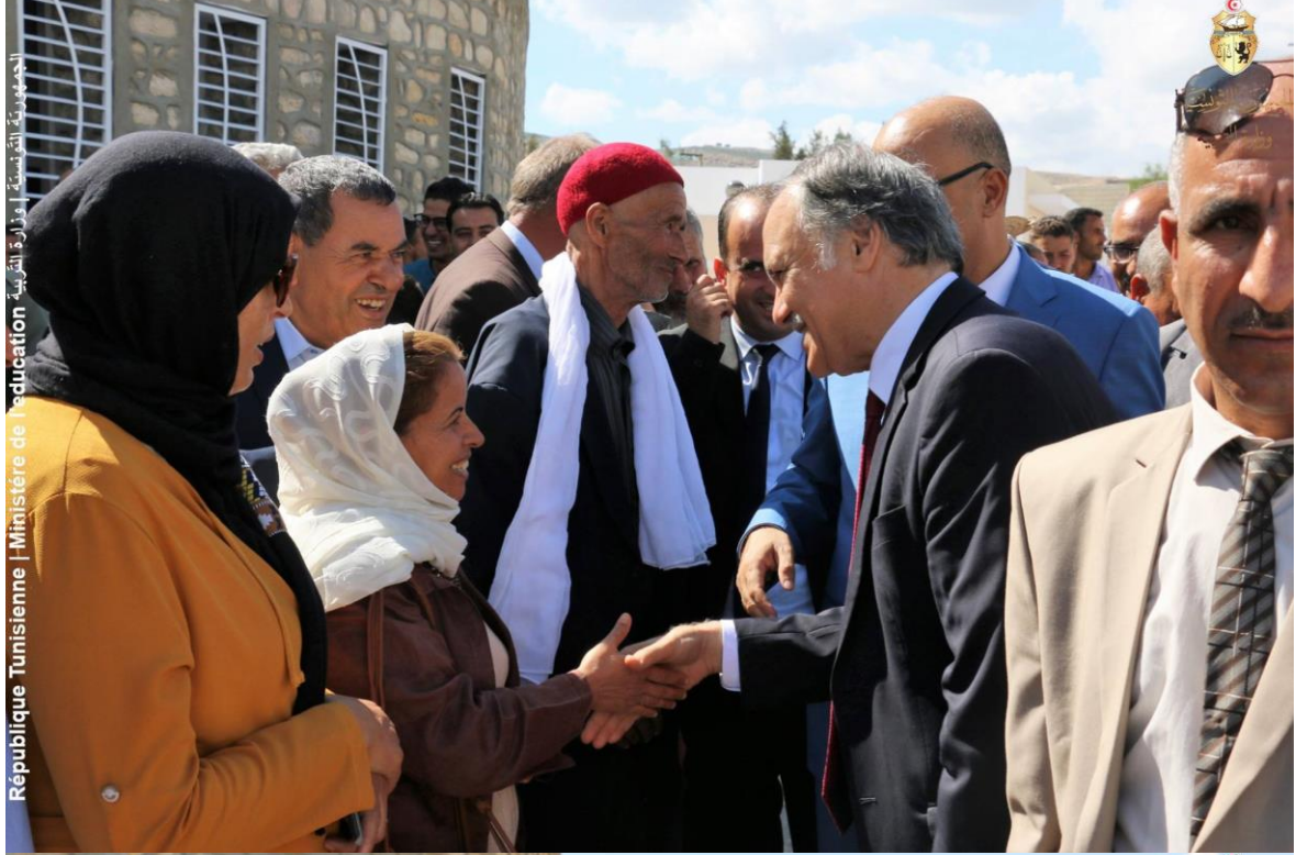
الجمهورية التونسية | وزارة التربية | Ministère de l'éducation | République Tunisienne