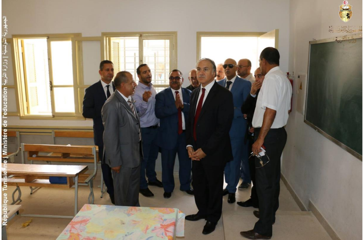
الجمهورية التونسية | وزارة التربية | Ministère de l'éducation | République Tunisienne